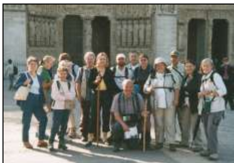
Notre-Dame de Paris après l'accueil de Mg Jacquemin