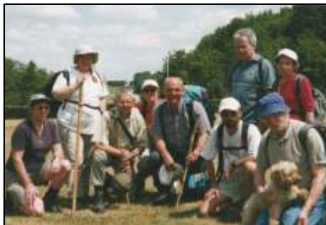
Une pause dans le parc de Sceaux