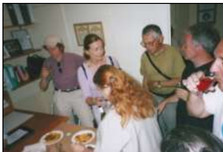
Le pot au 26 rue de Sévigné