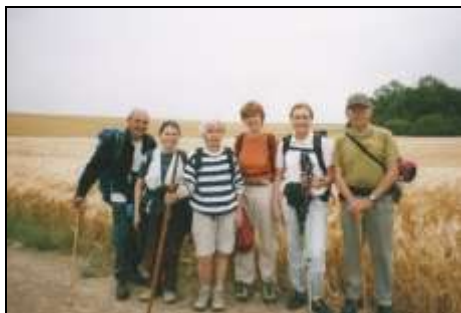
Le 1 er jour en Val d'Oise