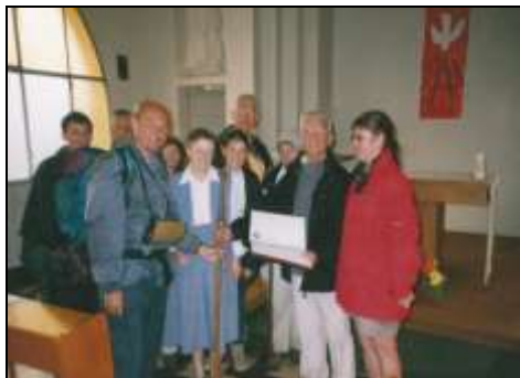
Remise du Livre d'Or aux Amis de Saint-Jacques à Epernon