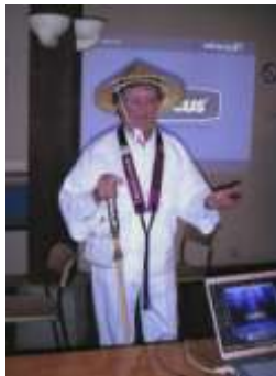
Un défilé de mode ?

Un compte rendu de la session sera remis début 2009 aux participants et rendez-vous est donc pris pour 2010 avec les pèlerins et marcheurs ayant parcouru tout ou une partie du chemin de Compostelle et désirant en partager les bienfaits.