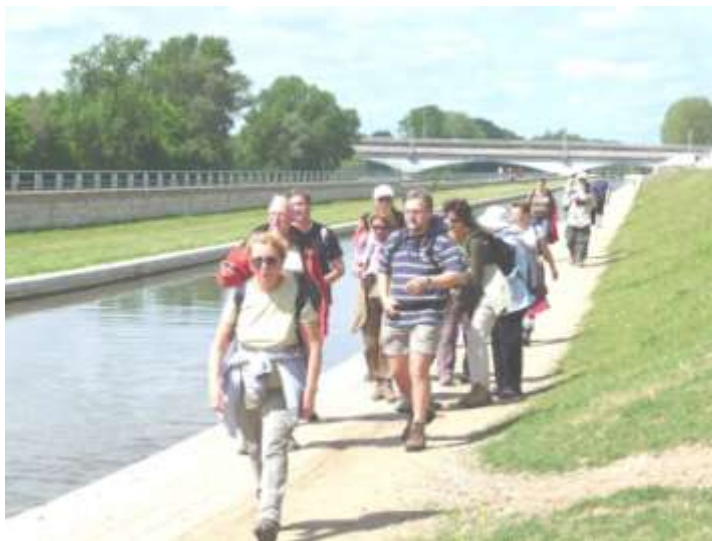
Un weekend à Orléans

Des précisions sur l'organisation et sur les horaires seront apportées dans le Bulletin n° 19