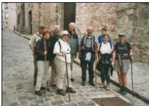
Jonction à Epernon avec les Amis de Saint-Jacques d'Eure et Loir